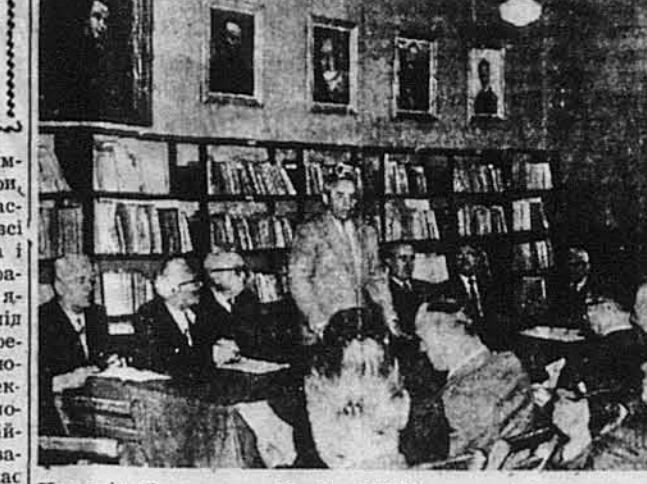
Президія Загальних Зборів НТШ, що відбулися дня 27-го листопада 1960 р.