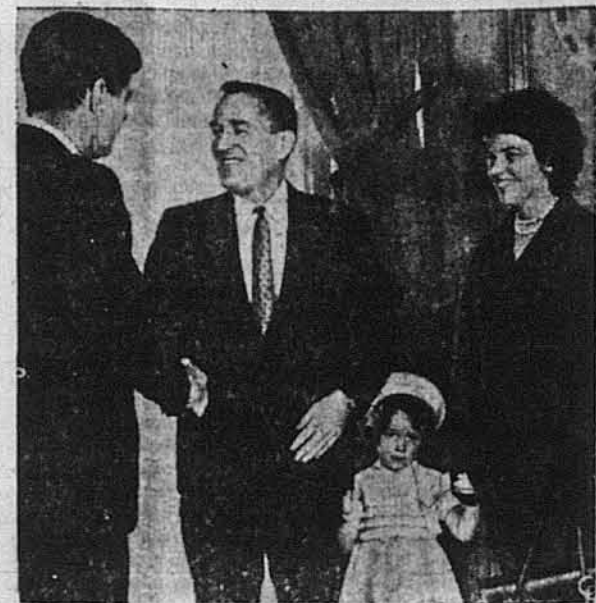
Президент Кеннеді (ліворуч) гратує Поліві Б. Фесі, молодшого підсекретаря флоту. В урочистості записання брали участь дружина Фесі Аніта і донька Селлі.