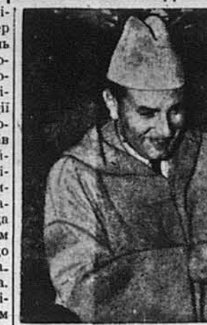
Король Мохаммед V

Рабат, Марокко. — В неділю, дня 26-го лютого помер тут на 51-му р. життя король Мохаммед V-ий, який був володарем Марокка від 1927 року. Смерть його наступила після не надто важкої операції після і після трьох годин наполегливого змагання лікарів зрятувати його життя. Негативно після проголошення повідомлення про смерть Мохаммеда V-го, новим королем Марокка проголошено принца Мулая Гассана, який є 13-м членом династії Алауїтів, що виводить себе від Алі, зятя самого пророка Мохаммеда. Принц Мулай Гассан володітиме в Марокко під іменем Гассана II. Покійний король був шанований і люблений цілим населенням Марокка, що нараховує яких 10 мільйонів душ і його смерть викрила усю країну жалобою. В історії Марокка він записався як той, що об'єднав марокканський