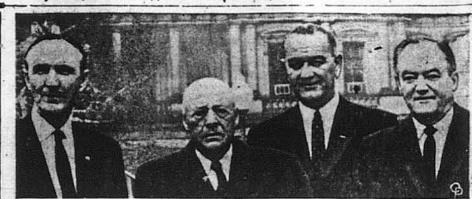
Провідники Конгресу після зустрічі з Президентом Кеннеді в Білому Домі, присвяченій обговоренню ситуації на Кубі. На фото (зліва): провідник сенатської більшості сенатор Майк Менсфілд, спікер Палати Сем Рейбірн, віцепрезидент Ліндон Джонсон і демократичний «ліп» у Сенаті сенатор Гюберт Гомфрі.