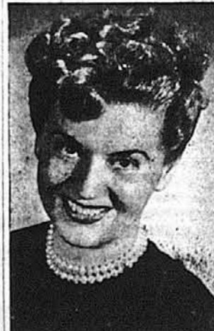
Оперова співачка Марія Лисогір