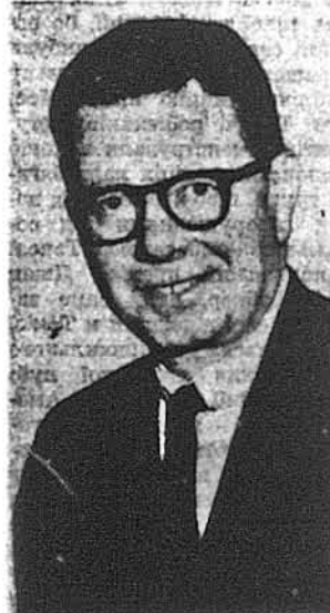
RICHARD J. HUGHES

JUDGE HUGHES IS A DEMOCRAT A Friend of the Working Man A Family Man With 9 Children He shall expand Rutgers University for your sons and daughters He will provide more State Hospitals for the poor and aged He plans for Better Benefits for Unemployed New Industries to State so as to increase employment More Housing and Medical Care for Elderly People President JOHN F. KENNEDY Wants You to vote for Him