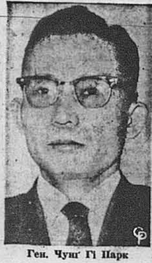
Ген. Чунг Гі Парк

Вашингтон. — Президент Кеннеді конферував 14-го листопада з головою південно-кореєського уряду генералом Чунг Гі Парком і обіцяв йому "всю можливу економічну допомогу", даліш військову допомогу, і, якщо комуністи поновлять атаку, то ЗДА вшлють більше своїх військ до Південної Кореї. В столиці півночі зустрілися представники Кореї, якого урядова функція є така: голова Найвищої Ради для відбудови Кореєської Республіки. Генерал Парк конферував також із державним секретарем Діном Раском. 44-річний генерал керує Кореєською Республікою від травня 1960-го року, коли він скинув був уряд, що його загальною аважали за нездійснені виконання своїх функцій. Представники ЗДА, які з резервою відносилися до травневого перевороту в Сеулі, тепер хвалять генерала Парка за той поступ, який зробила Корея від того часу. Ген. Парк конферував годину і 20 хвилин із Діном Раском, який представляв корейського гостя Президентові і членам кабінету під час другого сидання в Білому Домі. По полудні ген. Парк конферував із Президентом впродовж години і 15-ох хвилин. Президент із задоволенням прийняв завіт генерала про ситуацію в Кореї та тішиться тим поступом, що там відбувається. Ген. Парк вказав, що треба було зробити військовий переворот, щоб перевести соціаль-