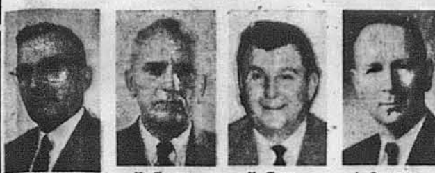
С. Омелюченко Грінсбі, Онт. 135 М. Ткачук Шикаго 115 М. Турко Форд Сіті 115 І. Скопич Філадельфія 85