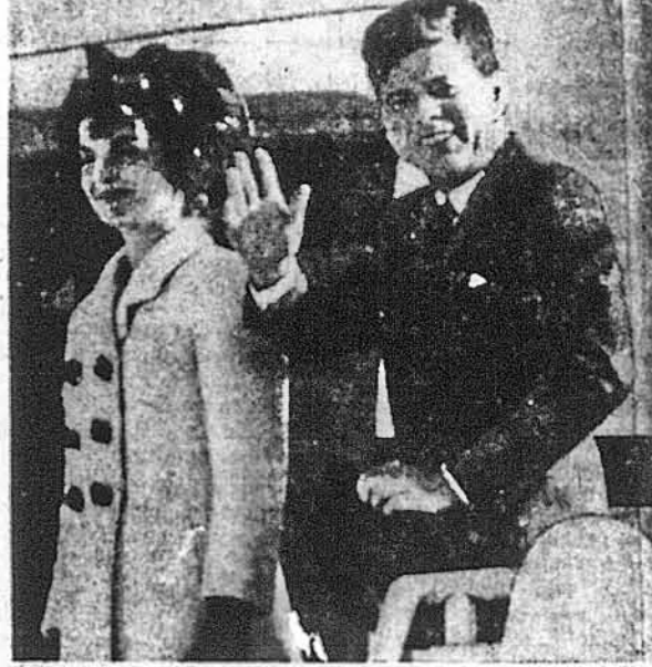
Президент Джон Ф. Кеннеді із своєю дружиною на східній літаку, що ним вони відбули подорож до Порто Ріко, Венесуели та Колумбії.