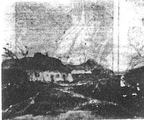
М. ЖЕВАГО: В ПОНЕВОЛЕННІ УКРАЇНИ