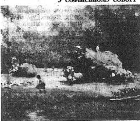
Ів. КУЧМАК: БУРЯ НАДХОДИТЬ