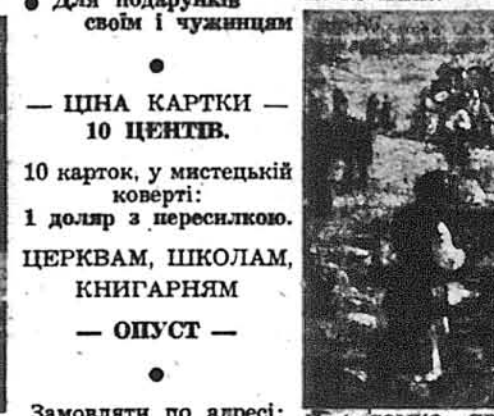
Надія СОНКО: ЯРМАРОК НА ЧЕРНІВЦІВЦІ