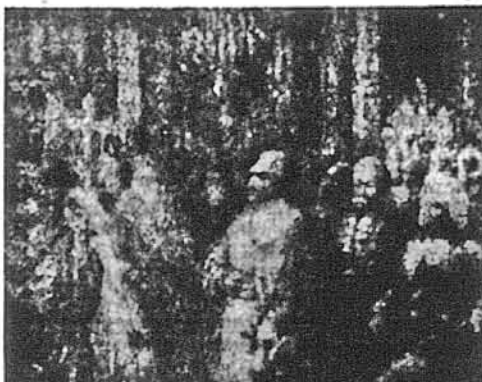
Н. СОНКО: ГЕТЬМАН І. МАЗЕПА У СОФІЙСЬКОМУ СОВОРІ