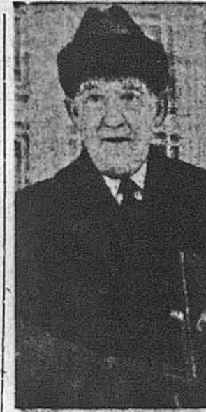
Амбасадор Ловеллін Томпсон після конференції з міністром закордонних справ СРСР Андрієм Громиком.

Ному австрійському професору Гансом Тірінгом. Хрущов потвердив, що єдиний шлях для міжнародних відносин у вірі є співіснування і економічне суперництво між капіталістичними та „соціалістичними“ країнами, бо альтернативою такого стану є тільки катастрофа для цілого людства ракетно-ядровою війною. Хрущов назвав три справи, що їх треба розв'язати задля встановлення тривалого миру: загальне і тотальне роззброєння під міжнародною контролею, ліквідація „імперіалістичного“ колоніалізму і справа Німеччини й Берліну. Західні інтерпретатори звертають увагу, що Хрущов поставив справу Берліну шойно на третьому місці, з чого виходило б, що він не думає натискати на підписання мирового договору з „двома Німеччинами“ й на ліквідацію волі Західного Берліну. Зате східно-німецькі комуністи продовжують горіжирити і цукувати. В їх органі „Носс Дойчланд“ вони зайняли негативне становище до відновлення альянтісько-совєтських інформаційних розмов на дипломатичному рівні, — бо, мовляв, немає вже що висловити після того, як уже „все ясно“, що існують дві Німеччини та що муніципальні відносини, в яких „Совєтський Союз дозволив західним альянтіам на тимчасовий вступ до Берліну“.