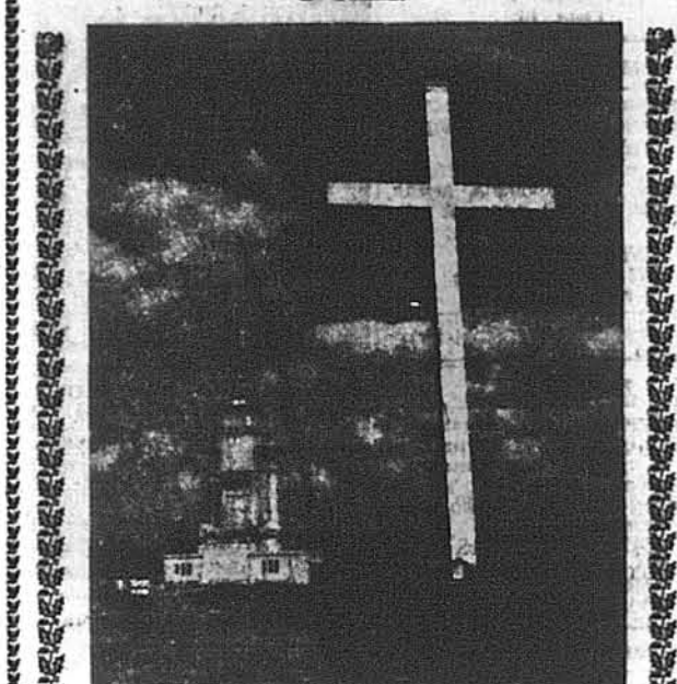
Церква-Пам'ятник від сторони Центрального Українського Православного Цимітара в С. Банди Вруку, Н. Дж.

КОНСІСТОРИЯ УКРАЇНСЬКОЇ ПРАВОСЛАВНОЇ ЦЕРКВИ в США.