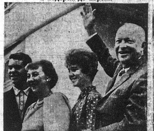
Колішній президент Двайт Д. Айзенгавер, його дружина і вилучи відїжджають до Європи кораблем „Квін Елізабет”.