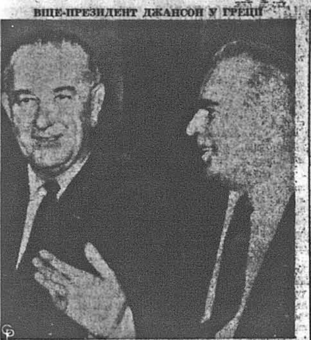
Віце-президент Ліндон Джамсон, у своїй подорожі до країн Середнього Сходу і Середземноморського обшару відвідав також Грецію. На світлині бачимо його у товаристві грецького прем'єра Константина Караманліса. Греція стурбована припиненням американської готівкової допомоги для грецьких збройних сил. ЗДА будуть й надалі помагати Греції збройними вирадами та позиками для важкого промислу.

Місячні Збори Т-ва „Запорозька Січ“, Відл. 349, в год. 2:00 по пол., в церкві Союзу в Ріпіні, Н. Дж., в год. 2:00 по пол. Присутні всі члени обов'язково прибути. — Управ.