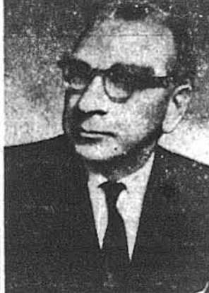
Інж. Осип Бойдуник

Нью-Йорк. — Інж. Осип Бойдуник, голова Української Національної Ради, який перебував тепер на відпочинку в ІД та який минулого місяця після серцевої атаки був в критичному стані в одному із місцевих шпиталів, покинувши вже шпиталь та поступово приходить до повного здоров'я в домі свого братиначи в Тінек, Н. Дж. Лікарі, під опікою яких голова УНРади перебував під час недуги, мають надію, що інж. Бойдуник повний відужав та скоро зможе повернутися до своїх звичайних обов'язків, чого йому щиро бажають численні його приятелі і знайомі та вся велика українська громада в Нью-Йорку.