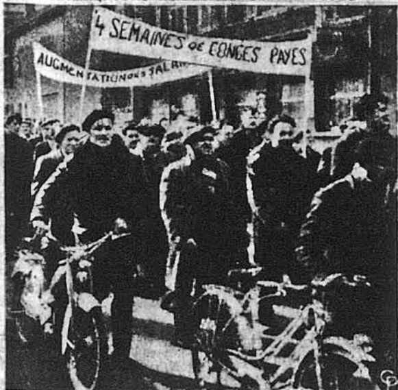
Шахтарі із французької провінції Лоррен йдуть демонстраційним походом вулицями Мерлебаку з написаними на транспарантах вимогами короткого часу праці і збільшення заробітної платні. Досі вони одержували пересічно 142 долари місячно.