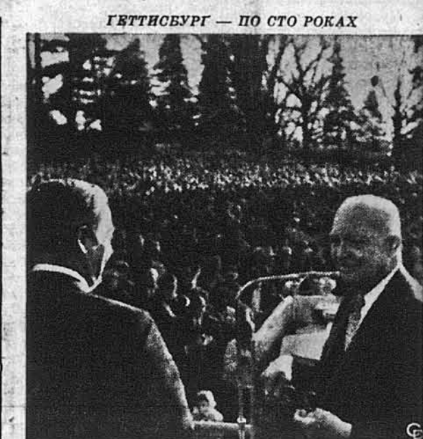
Колишній президент ЗДА Дейт Д. Айзенгавер (з правого боку) звертається до пенсильванійського губернатора Вільяма Скрентона (перший зліва) під час своєї промови в Геттисбурзі, що й виголосив 19-го листопада, в сторіччя історичної промови Абрама Лінкольна. В урочистості відзначування цього сторіччя, що відбулося на геттисбурзькій Національній Військовій Цитаделі, взяло участь 4,000 осіб.

Організацій Джорджіні Міні Похвальну Грамоту за "надзвичайну працю в інтересі національної оборони". В Грамоті хвалиться АФП-КІО за те, що робітники зменшили число втрачених днів при праці у фабриках, що продукують керванні ракети.