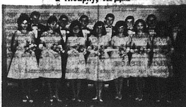
Дебютантки в Ньюарку

Прихильники пластової молути для Пласту. Публіка лоді під головуванням д-ра І. Карапіки і при співпраці забавового комітету улаштували забаву, яка притягнула численну публіку з Ньюарку й околиць, буйну, веселу молоді, а всіх, — ким кров живо кипить, як казав поет.