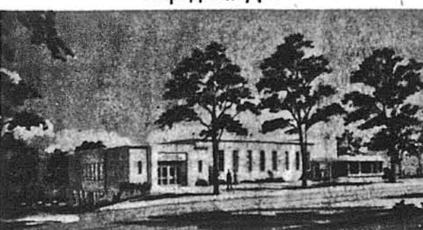
Проект Українського Народного Дому в Гартфорді у виконанні архітекта інж. А. Осадци.