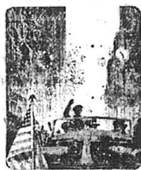
1945—War ends. Savers cash Bonds for things they want—and then buy more.