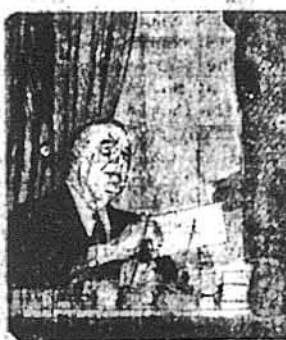
May 1, 1941—The President buys the first Series E Savings Bond.