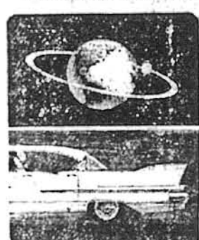
1957—Cars sprout fins, Sputnik orbits, savings in Bonds top the $41 billion mark.