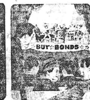
1943—By the end of the year, Americans own $16 billion worth.