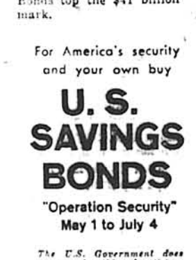
For America's security and your own buy