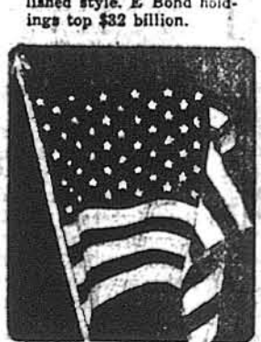
1960—July 4, the U.S. flag adds its 50th star. Bond-buying Americans hitch their wagons to all 50.