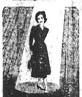
1946—The "New Look" is in, but Bonds are an established style. E Bond holdings top $32 billion.