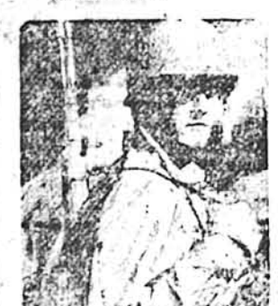
1952—Fighting continues in Korea. Bonds help defend freedom again. Series H Bond introduced.