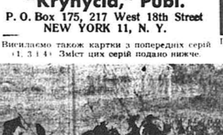
Василь Кричевський: Київ. Вигляд на Печерську Лавру (4-та серія)