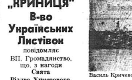
Василь Кричевський: Київ. Вигляд на Печерську Лавру (4-та серія)