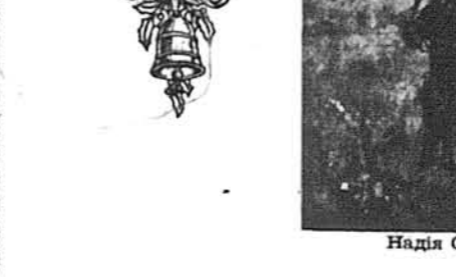
Василь Кричевський: Київ. Вигляд на Печерську Лавру (4-та серія)