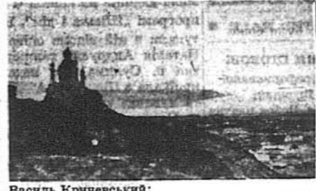
Василь Кричевський: Київ. Андріївська Церква (4-та серія)