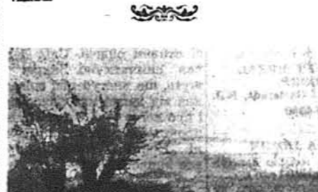
О. Скруток: Тихий закуток (5-та серія)