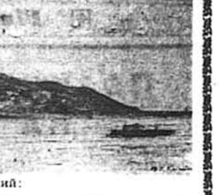
Василь Кричевський: Київ. Вигляд на Печерську Лавру (4-та серія)