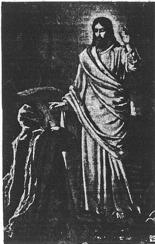
І ТРЕТЬОГО ДНЯ ВІН ВОСКРЕС...

"МОСКОВСЬКИЙ КОМСОМОЛСЬКИЙ" ШИРОКО ОПИСУЄ , як-то один московський "патріот" з обуренням відкрив на кольоровій хустині однієї молодої жінки в підземці — малу передової Німеччини, як Щеттін. Як Щеттін, як Кенігсберг, Московський більшовик прийняв на себе роль детектива і виявив, що та молода жінка два роки тому купила ту хустину в московській державній крамниці та не знала, що вона носить на голові доказ "німецького імперіалізму-реваншизму".