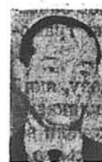
А. Степан квітень — 21