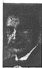
І. Одежкінський березень — 21 квітень — 29