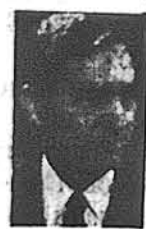
В. Зорич березень — 18 квітень — 12