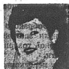
Анна Дубас березень — 18 квітень — 16