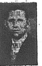
І. Горич березень — 10