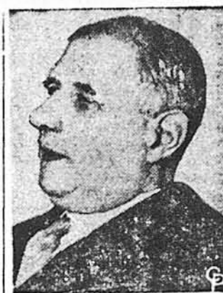
Президент Шарль де Голль

Париж. — Французький президент Шарль де Голль був переобраний на президента в тісних виборах в минулу неділю 19 грудня ц. р. більшістю 12.736.661 голосом, себто 54,7% проти 10.585.150 голосів, або 45,3% що їх дістав противник де Голля, Франсуа Міттеран, кандидат лівиці. Міттеран признав перемогу де Голля, але відмовився скласти йому з цього приводу бажання, бо вибір де Голля був — за заявою Міттераном — шкідливий для Франції. Де Голль обрано, згідно з конституцією, на чотирьох сім років. Хоч де Голль заявив, що він задумує урядувати повну каденцію, проте це річ сумнівна з уваги на його вік: річ має вже тепер 75 років. Де Голль вів передвиборчу кампанію під гаслом — за збереження системи, введеної де Голлем, проти політичних партій. — а Міттеран за привернення республіканської демократичного устрою, що його де Голль —