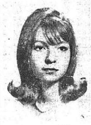
Каролін Анн Робертс Форест Гіллс, Н. Й.