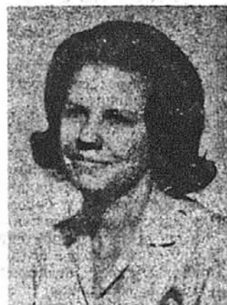
Марія Пасична Асторія, Н. Й.