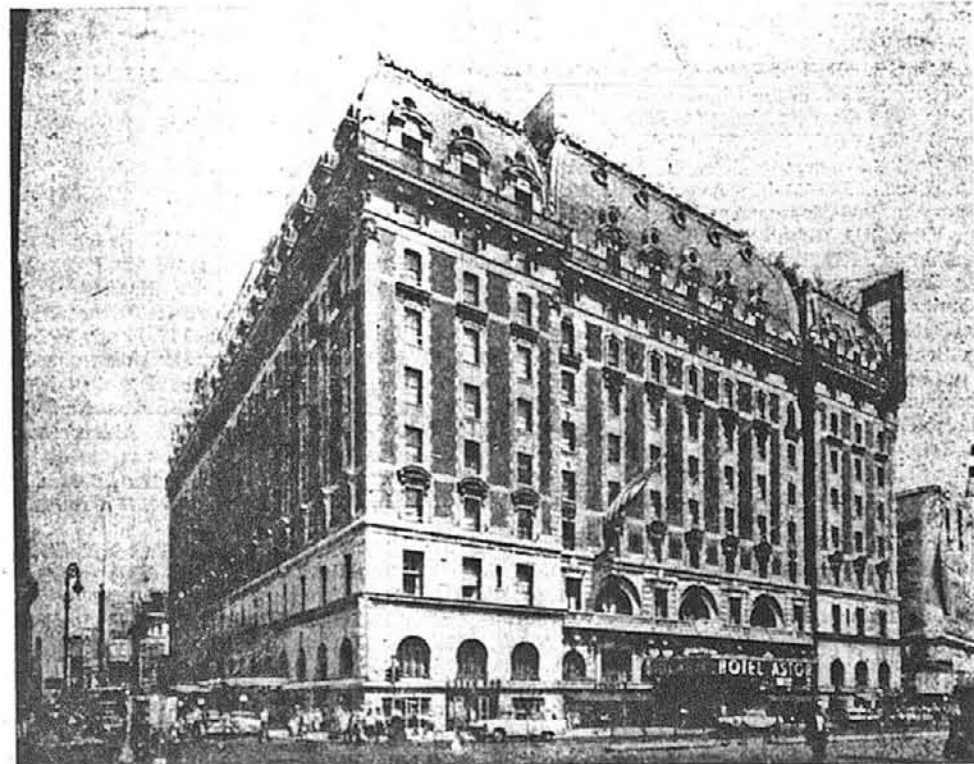
Готель „АСТОР”, Нью Йорк, Н. Й.

Зарезервовані столи просимо викупити найдальше до 27-го СІЧНЯ н. р.