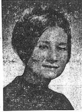
Дана Маліоза Джерал Сіті, Н. Дж.