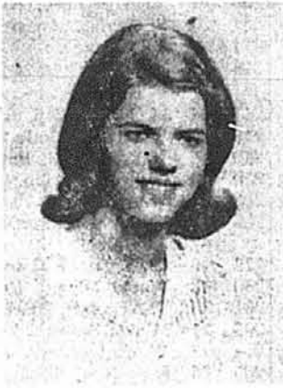
Зірка Дідух Юніон, Н. Дж.