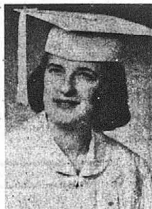
Христя Пригада Картерет, Н. Дж.