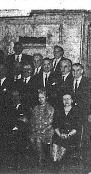
Учасники Загальних Зборів Окружного Комітету Відділів УНС в Нью Йорку.

Довгі старання придбати постійного а то й обласного організатора для міста та стейту Нью Йорк, який допомагав би місцевим Відділам, покищо не поведи. Робимо далі намагання підшукати відповідних постійних працівників УНСОюзу, але невідомо, коли це станеться. Активність місцевих Відділів нашої великої метрополітальної громади, зокрема на організаційному полі, не є задовільною. Її конкретно треба збільшити та довести до того, щоб Нью Йорк і його округа стали прикладом для всіх Відділів і Округів в краї. Адже наша громада є найбільшою у вільній світі. Вважаю з усіма Відділами, їх урядами та загальною членством, обговорити їх організаційні труднощі й по моїй змозі та змозі головної кан-