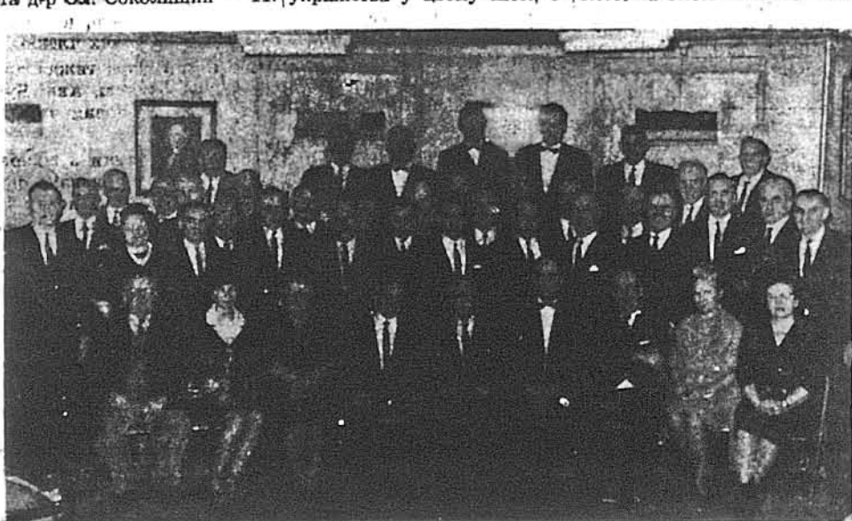
Учасники Загальних Зборів Окружного Комітету Відділів УНС в Нью Йорку.