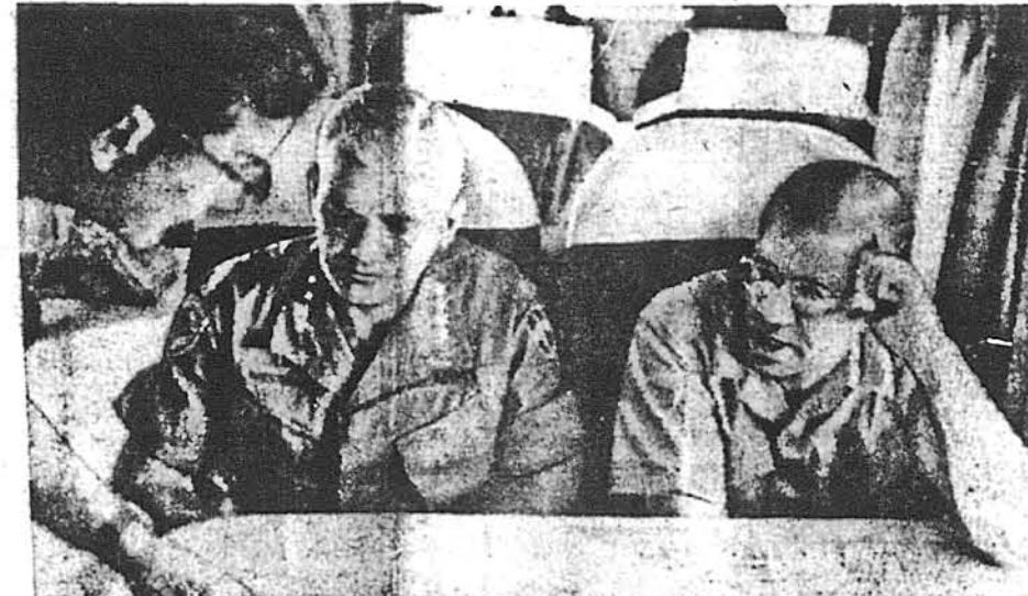
Секретар оборони Роберт МекНамара (зліва), разом з головним командантом американських збройних сил ген. Вільямом Вестморлендом, студіюють мапу в гелікоптері, літаючи ним понад т. зв. демілітаризованою зоною між Північним і Південним В'єтнамом, що є головним бастионом комуністів.

Сайгон. — Відбувши наради з представниками командування збройних сил ЗДА у Південному В'єтнамі, секретар оборони ЗДА Роберт С. МекНамара конферував також з провідниками південнов'єтнамського військового режиму: головою держави ген. Нгуєном Ван Тіе, прем'єром Нгуєном Као Кі та міністром оборони Південного В'єтнаму Као Ван Вієном. Розмови стосувалися військової ситуації у В'єтнамі. Згідно з повідомленнями кореспондентів МекНамара мав висловити в цих розмовах своє незадоволення з не-ефективності мілітарної участі збройних сил Південного В'єтнаму у військових операціях і з заходів зацілюваних у зв'язку з програмою відбудови й замирення сільських районів. Після інспекції теренів військових операцій та розмов з представниками американського командування МекНамара оцінює ситуацію в Південному В'єтнамі досить оптимістично. Він зокрема не вірить у видатне збільшення мілітарної участі Північного В'єтнаму у воєнних діях в Південному В'єтнамі, що передбачувала військова розвідка, повідомляючи, що з Північного В'єтнаму проникає на територію Південного В'єтнаму кожного місяця