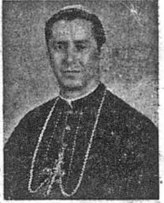
Преосв. Кир Ярослав Габро

Шикаго. — Тільки добрі вісті приходять тепер з Шикаго. Екзекутива Фонду Катедри Українознавства інформує, що єпископ української католицької дієцезії св. Миколая в Шикаго, Преосв. Кир Ярослав Габро, переіслав $1,000.00 на ФКУ, ставши тим самим меценатом-фундатором українських студій в Гарвардському університеті. В супровідному листі до Екзекутиви ФКУ, датованому 8 березня 1968, Преосв. Кир Ярослав м.п. пише: