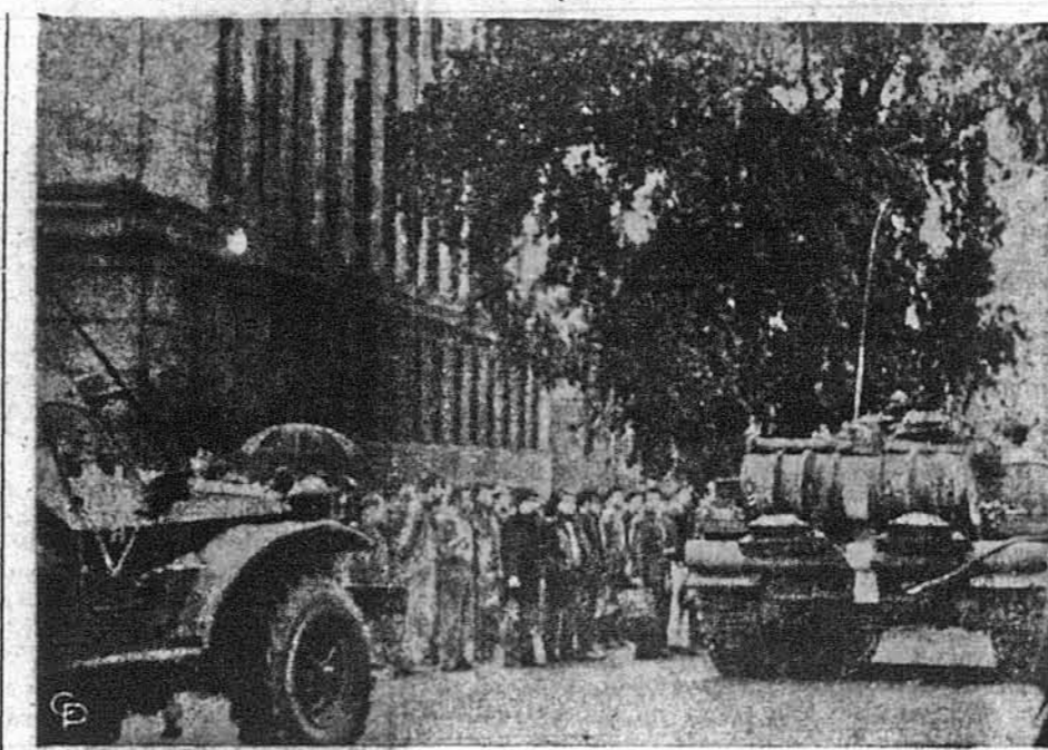
Із почуттям розпачу й із сльозами на очах населення Праги зустрічало прибуття советських танків і панцерних вояків. Подекуди чехи творили живі барикади, сідалиши поперек вулиць, або й атакували советські танки, запалюючи і знищуючи їх. На фото: советські з'єднання оточують будинок Центрального Комітету Комуністичної Партії Чехо-Словацьчини. Так само, як і Прагу, совети окупували й усі більші міста ЧССР

Шість членських держав Ради Безпеки Об'єднаних Націй — ЗСА, Британія, Франція, Канада, Данія і Парагвай зголосили листа до цьогочасного голови Ради Безпеки, бразилійця Хоже Аравіо Кастра, щоб негайно скликати Раду Безпеки задля розгляду советської інвазії в ЧСР. Рада Безпеки зібралась у середу о год 6.20 попол. і радила до 10.30 веч. рішення продовжувати на раду у четвер о 10.30 перед пол. Речник СССР Яков Малік намагався переконати прихильників, що Рада Безпеки «не має права» обмірковувати цю справу, бо СССР і його союзники вяршували до ЧСР «на запрошення тамошнього уряду». Він повторював, що в Чехословацькій діяли «реакційні сили» підтримували «закордонними імперіалістами» і коли тільки минеться загроза, що ЧСР буде жертвою тих реакцій, то негайно війська СССР і його союзників будуть відкликані. Однак однаково американський амбасадор Джордж Волл, як і британський амбасадор лорд Карадон і канадський речник