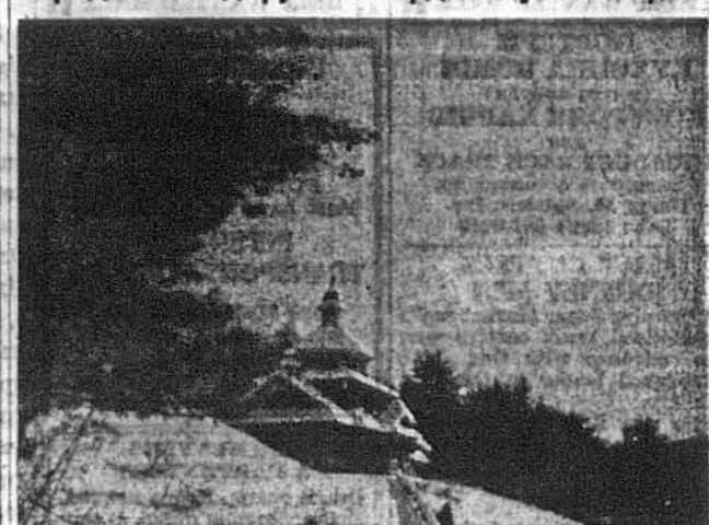
Помешчена фотознімка великого кольорового фото, що буде подароване Кардиналові Йосифові Сліпому