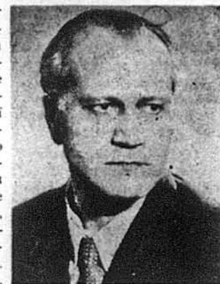
Микола Лівіцький, Президент УНР в екзилі

Джерзі Сіті. — Президент Української Народної Республіки в екзилі, п. Микола Лівіцький, що сам є професійним журналістом, матиме святочне слово під час імпрези, що відбудеться цієї суботи, 14-го вересня, на Союзівці, оселі Українського Народного Союзу в Кетс-кільських горах, з нагоди 75-річчя „Свободи“. Перше число „Свободи“, як відомо, появилось з датою 15-го вересня 1893-го року, отже щодня точно 75 років тому. Від того часу „Свобода“, ставши офіційним органом створеного з її ініціативи в 1894-му році Українського Народного Союзу, безперервно повинні 75 років служити своєму народові та своїй громаді і с сьогодні найстаршою українською газетою в світі, включно з Україною. Факт, що отільки на американській землі могла встоятися впродовж 75 років вільна українська газета, говорить своєю трагічною мовою, бо хоч в Україні почали появлятися українські газети — спочатку французькою і німецькою, а опісля українською мовою — багаторазово, то їх беззастановно нищили і припиняли окупанти української землі. Своєю 75-тим роковинам прижити „Свобода“ своє видання з суботи, 14-го вересня, і того ж дня, як згадамо, відбудеться на Союзівці