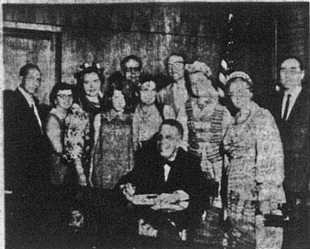
Губернатор Арізони Джек Вілліамс підписує прокламацію

Цьогорічне відзначення Тижня Поневолених Народів відбулось 24-го липня в аудиторії „Грейді Гаммаге“ — Темпі у вечірніх годинах. Свято підготував відділ Комітету Поневолених Народів в Феніксі під проводом голови п. інж. Володимира Чопівського. Воно випало імпульсивно та репрезентативно. Розпочато його концертом відповідального редактора газети, кімнати референтів тощо. З будинку можна потрапити у внутрішній двірчик з його квітами і фонтаном, біля якого так приємно посидіти і відпочити в час дозвілля. При цьому варто нагадати, що це за Сталіна в подібних місцях астановлювали мікрофони для підслухування приватних розмов чи висловів; за найновішою технікою такі мікрофони амуровують цілком непомітно у стіни, в ніжки столів, лавок тощо.