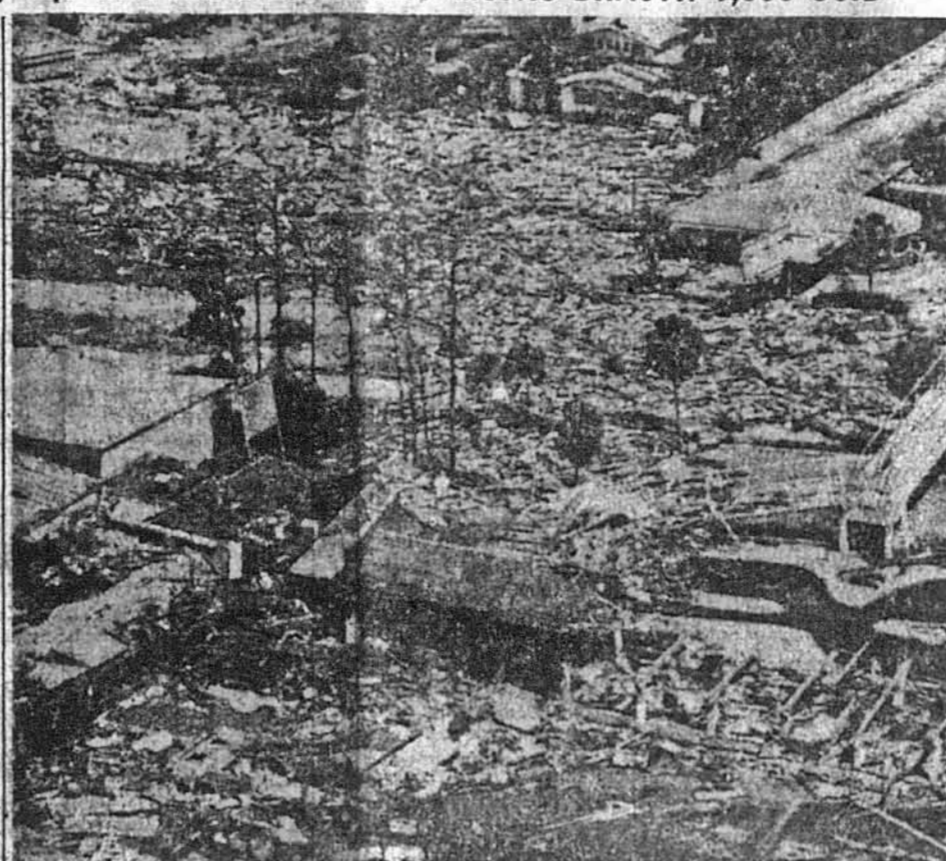
Так виглядає зруйнована дощенту місцевість Білокелі в стейті Міссісіпі після того, як через неї пройшов із швидкістю 190 миль на годину гураган Камілія. Гураган захопив своєю активністю територію в 600 квадратних миль і спричинив важкі втрати і шкоди

Голфпорт, Місс. — До ві-тірка, 19-го серпня, знайде-но і виловлено з води 170 трупів, що впали жертвою жакливого гурагану Камілі-ля, який пронісся над стей-тами Міссісіпі, Луїзіана та частиною Алабама, заливаю-чи водою і змиваючи із зе-млі цілі оселі. Стейтві влас-ті побоюються, що загальна кількість людських жертв цього гурагану може дійти до 1,000 осіб. В районах, що їх навістив гураган, прого-лошено військовий стан і стейт-ова поліція та цивільна гвардія намагається при-пинити великий наплив гля-дачів у ці райони. Попере-днього дня президент Ніксон проголосив стейт Міссісіпі районом нещастя та приза-чить мільйон доларів феде-ральних фондів на допомо-гу потерпілим. Тепер таким самим районом більшого не-щастя проголошено також Луїзіану та призначено і цьому стейтві мільйон до-ларів федеральної допомоги. Гураган над цим стейтами пронісся зі швидкістю 190 миль на годину. Крім жертв в людях, матеріальні шко-ди від гурагану досягають більйона доларів.