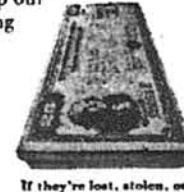
If they're lost, stolen, or destroyed, we replace 'em.

Think about U.S. Savings Bonds. It's a way to keep our country from getting folded, spindled or mutilated.