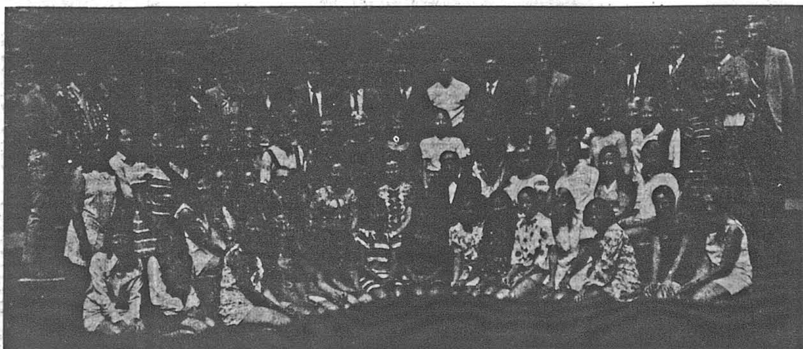
Учасники цьогорічного 17-го з черги курсу українознавства на Союзівці із своїми учителями та опікунами

За посередництвом представника Об'єднаних Націй, дипломата Гуннара Яррінга, Віноградов, який був советським амбасадором в Єгипті від 1967 року, відіграв вирішну роллю у віднасканні Москвою "обличчя" в арабському світі після прогрі арабів у червні 1967 масовими новими доставками зброї для арабів. Віноградов скінчив був Ленінградський університет та був амбасадором ССРСР в Туреччині в р.р. 1944-1948. В Акарі представник де Голя сугерував йому, щоб Москва визнала екзильний уряд Франції під час другої світової війни: Віноградов передав ту ідею до Москви, яка зробила це і від того часу між ним і де Голлем існували приятельські зв'язки. Завдяки цьому він став був амбасадором ССРСР у Франції в 1953 році і був ним до 1965 року. Причини його несподіваної смерті не подано.