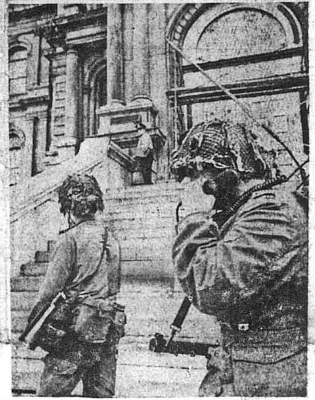
КАНАДА ПІД ЗНАКОМ ВОЄННОГО СТАНУ. На фото вгорі: прем'єр Трудо (перший з правого боку) виходить із свого бюро в парламенті перед проголошенням воєнного стану в Канаді. Внизу: воєнки канадської армії охороняють будинок міської ратуші в Монреалі, Квебек.