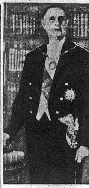
Шарль де Голль

Париж. — Колишній президент Франції і її національний герой Шарль де Голль помер коло год. 7 вечером у понеділок 9 листопада, діставши серцевого нападу, коли сидів у фотелі і придивлявся телевізії. Французький прем'єр Жак Шабан-Дельма негайно поїхав до Елізабейського палацу, щоб порозумітися з президентом Жоржем Помпиду щодо похорону де Голля. У Франції проголошено національну жалобу. — Політична кар'єра де Голля розпочалася після 14 червня 1940 року, коли-то німецькі війська вмишували до Парижу й за згодою німців склався французький уряд маршала Філіппа Петена у Віші. Мало до того часу відомий у Франції і поза нею старшина Шарль де Голль спротивився капітуляції Петена, переїхав до Лондону і там створив тимчасовий закордонний уряд Франції. Після здобуття Парижу альянськими військами де Голль став головою французької держави і був ним від вересня 1944 до 1 січня 1946 року. Не хотівши підчинитися парламентарно-партійній системі 4-ої Французької Республіки — де Голль зрікся влади 1 січня 1946 р., але вернувся до неї 1 червня 1958 року під час кризи, що її Франція переживала у зв'язку з війною в Алжирі. 28 вересня 1959 р. прийнято — під натиском збоку де Голля — нову конституцію Франції, яка започаткувала 5-ту Французьку Республіку і де Голль став її першим президентом. Але 28 квітня 1969 р. плебісцит