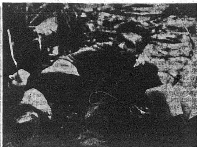
Кадр із кінофільму „Ніколи не забуду“