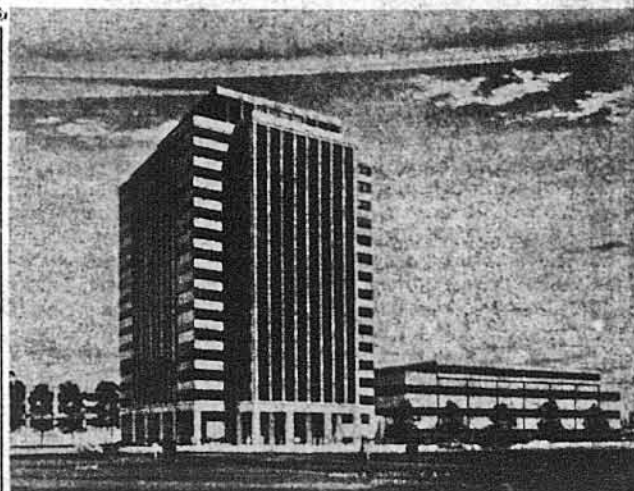
Так виглядатиме 15-поверховий хмаросяг УНСоюзу над Гудсоном у Джерзі Сіті після його закінчення.

рабля на корабель, що в такому випадку, мовляв, непередбачене договірними порозуміннями. Водночас із цим адмірал Бендер ствердив, що безпосередню децизію в справі видачі зробив віце-адмірал В. Б. Елліс, без будь-якої спеціальної інструкції чи доручення державного департаменту. Згідно із встановленим вже перебігом справи, втікачем із советського корабля був моряк на прізвище Сімас, литовської національності, який у понеділок 23 листопада перескочив із советського корабля на поклад американського катера і був виданий в руки советської залоги після беззаконного прибуття її на американський корабель і жорстоко членами цієї залоги побитий такі ж на американському кораблі. Представник державного департаменту Роберт Дж. Мек-Клоскі заявив у зв'язку із цією справою, що уряд ЗСА зробить все в його силах, щоб такі інциденти не повторювалися. Високий комісар ООН для справ втікачів принц Садруддин Ага Хань висловив у телеграмі до державного секретаря ЗСА Роджерса і в розмові з головою делегації ЗСА до ООН Чарльзом В. Ностом своє зурешення з приводу порушення З'єднаними Штатами Америки Конвенції з 1951 року про статус політичних втікачів, яка забороняє видавати втікачів тим державам, в яких їх життя або свобода могли б бути загроженої.