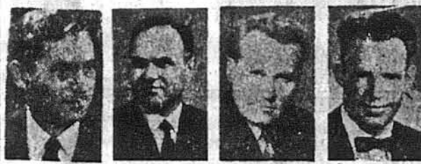
482 В. Зорич 27 407 В. Дідюк 26 341 В. Гіряк 25 83 С. Гавриш 21