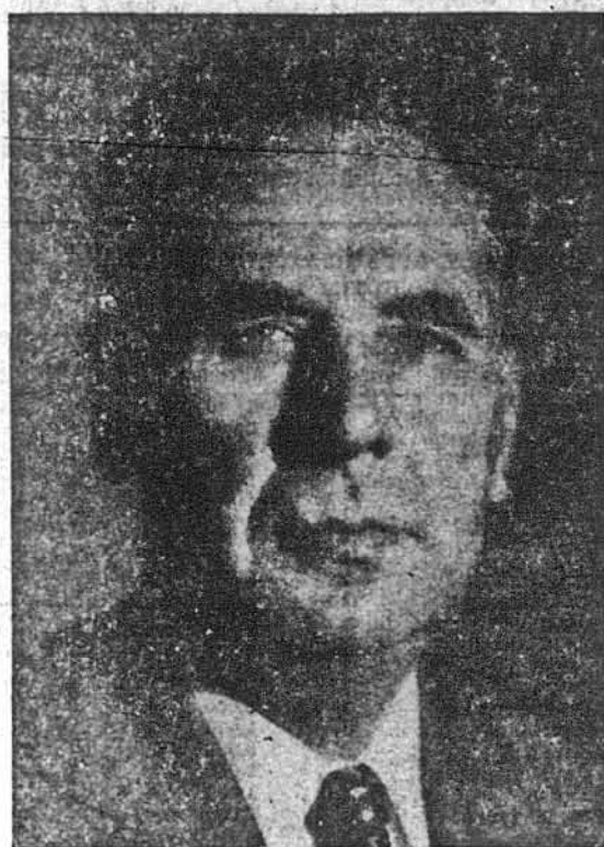
С. Л. Дмитро Галичін

Сьогодні, 26-го березня 1971 року, сповнилося точно десять років з того трагічного дня, як 26-го березня 1961-року відійшов у вічність, після нещасливого випадку, до-голітній раніше головний секретар і опісля головний пред-сідник Українського Народного Союзу, президент Україн-ського Конгресового Комітету та провідний діяч Амери-канської України, активний учасник Українських Визво-льних Змагань, св. п. д-р Дмитро Галичін. Його пам'ять вишанують з цієї нагоди члени УНСОюзу і громадяни Нью-Йорку Урочистим зібранням, що відбудеться старан-ням Окружного Комітету Відділу УНСОюзу цієї суботи, 27-го березня, в домі 361-го Відділу УНСОюзу, «Дністер» при 119 Есеніо, «А» в Нью-Йорку, після поминального Богослужен-ня, що буде відправлене в українській католицькій церк-ві св. Юра та українській православній церкві Всіх Святих при Іст 11-й вулиці о год. 12-й вполудне.