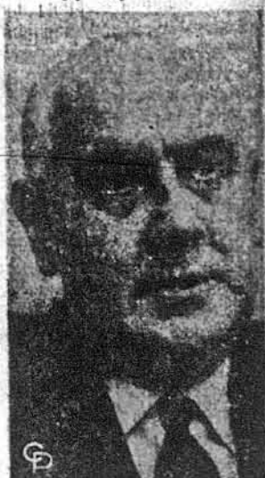
Ген. Александро Лянуссе, голова військової хунти в Аргентині

Буенос Айрес. — Військова хунта, яка після проведення мирного державного перевороту перейняла з витівки цього тижня фактичну владу в Аргентині, обіцяла у проголошеній з президентської палати заяві обмірковувати справу проведення виборів для відновлення конституційного уряду. Очолос цю військову хунту, після усунення дотеперішнього президента Аргентини ген. Левінгстона, командант армії ген. Александро Лянуссе і в складі її входять ще команданти легіонів збройних сил ген. Карлос Рей та командант флоту адмірал Педро Альберто Хосе Гнаві. З близьких до хунти кіл інформують, що ці вибори мали б бути проведені протягом найближчих двох років й обраний згідно з конституцією уряд мав би бути встановлений в 1973 році. Голова хунти ген. Лянуссе звернувся з закликом до населення зблизити про ас політичні розбіжності й об'єднатися для знайдення і проведення доконечних для оздоровлення окрема аргентинської економіки завдяки. Водночас із цим аргентинська хунта, бажаною здобути прихильність робітництва й підприємців, скасувала встановлену дотеперішнім президентом Аргентини