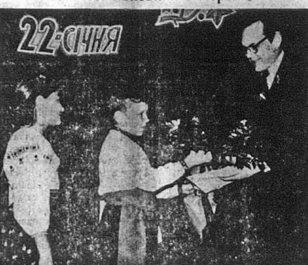
Вітають букетом троянд сенатора Роберта Тефта з Огайо, головного промовця на Святі Роковин Проголошення Незалежності і Соборності Української Держави, яке відбулося в Лорейні, Огайо: Роксолія Кармазин і Тарас Сілецький.

„Український нарід довгі роки бореться за незалежну соборну українську державу, українці так як і всі європейські народи мають природне право творити своє життя незалежно від втручання чужого насильства,“ — висловив такі думки на Святі Незалежності і Соборності в Лорейні Кавіті, Огайо, сенатор Роберт А. Тефт. Свято відбулося 21-го лютого.