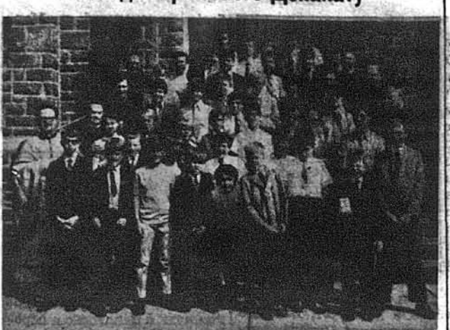
Учасники Конференції вістарних хлопців УПЦ в ЗСА в Честері, Па.