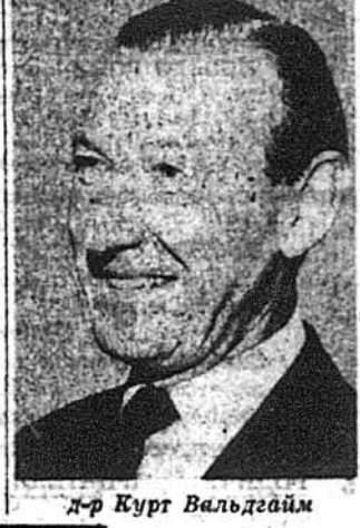
д-р Курт Вальдгайм

Об'єднані Нації. — Новий генеральний секретар Об'єднаних Націй д-р Курт Вальдгайм розпочав урядувати в минулий понеділок 3 січня 1972, прийнявши членів штабу Секретаріату ООН і амбасадорів ЗСА та Кіпру. Американський амбасадор Джордж Буш виявив згодом, що його розмова з Вальдгаймом с т ошулася передусім поганой фінансової ситуації Об'єднаних Націй. Вальдгайм вручив теж на окремій церемонії золоту медальку мира своєю попередниці У Тангові.