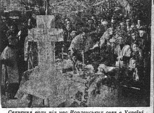
Свячення води під час Йорданських свят в Україні

БЛИСНЕМ ШАВПЯМИ... (Народна щедрівка) А в полі, в полі, й у виноколі, Стоять намети з білого шовку; А в тих наметах все столи стоять, Все столи стоять позастилані, Позастилані все килимами; А на тих столах все кубки стоять, Все кубки стоять понапоєнані. По за столами все нани сидять; Межи тими панамі, красній паничу, Красній паничу, пане Іване! Перед паничем вірній слуги, Простягає вони у невір-землю; „Пусті нас, пане, у невір-землю! Пустимо стрілку, як грім по небу; Пустимось кінями, як дрібєн дощик; Блиснем шаблями, як сонце в змарі!"