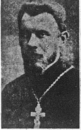
Архiepіскоп Василь Величківський (фото з поч. 1940-их рр.)

З кінцем минулого тижня з Риму одержано вістку, що там очікують звільненого із советського ув'язнення Архiepіскопа Василя Величківського. Раніше, вже в понеділок 14-го лютого, Католицька Пресова Служба повідомляла про звільнення Владика Величківського та його подорож до Риму. У повідомленні Католицької Пресової Служби сказано: