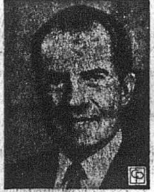
Президент Річард Ніксон