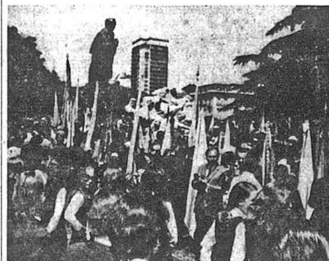
Полотно стягнуто, пам'ятник відкрито й могутня постаць Кобзаря високо підноситься на тлі прапорів та парку і докляканих будинків.