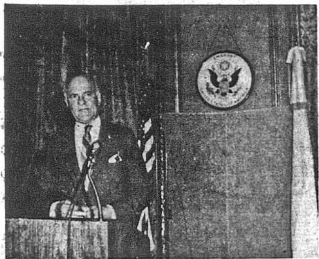
Амбасадор Ладж і його дружина так одушевились своєю угастю у відкритті пам'ятника Кобзареві України в столиці Аргентини та своїми зустрічами з українцями, що запросили до себе в гості групу українців з США в кількості приблизно 100 осіб. Гостина відбулася в приміщенні амбасаді в четвер, 9-го грудня. На фото: амбасадор Ладж вітає в амбасаді українських гостей з Америки. Під емблемою амбасаді висить синьо-жовтий український прапор, а по його боках зоряний американський та прапор амбасадора.