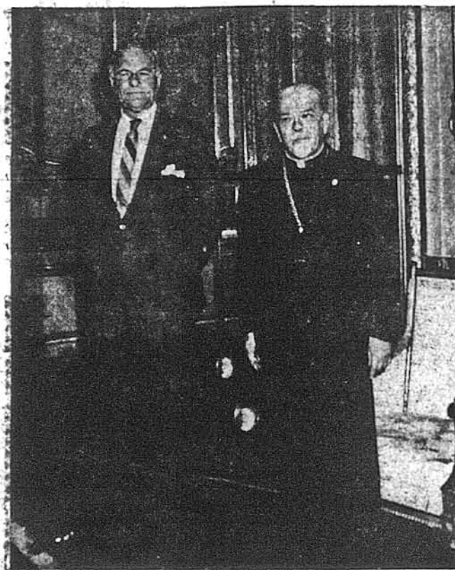
Амбасадор Ладж (зліва) з первосвященником УАПЦ Митрополитом Мстиславом. Ambassador Lodge (left) and Metropolitan Mstyslaw.