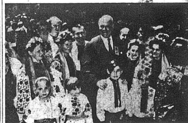
Подвійна радість амбасадора Ладжа та українського юнацтва — відкриття пам'ятника Тарасові Шевченкові та рідкісна зустріч при цій нагоді.