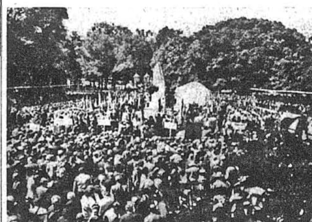
Після походу тисячні маси народу зібрались біля закритого пам'ятника, очікуючи зворушливої хвилини його відкриття.