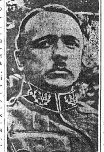
Ген. Олександр Удовиченко

Паризь. — У середині лютого генералові Удовиченкові сповнилося 85 років життя. Родом він із Харкова. Студіював у Військовій Академії в Петрограді, провадив українцізацію 2-го Кавказького корпусу, був дорадником Головного Отамана Симона Петлюри у воєнних справах, брав участь у формуванні Гайдамацького Коша й переможних боях проти комуністів за "Арсенал" у Києві. Після різних важливих постів, у 1919 р. визначився як командир 3-ї Залізної Дивізії в завзятих боях біля Валпярки. Хворий на тиф, потрапив до полону Денікіна, внаслідок чого, втік з полону, прорвався з групою воїнків до Могилева - Подільського, відновив там Залізну Дивізію і командував нею до відходу армії за Збруч. У Франції ген. Удовиченко живе з 1924 р., працював звичайним робітником і займався громадською працею.