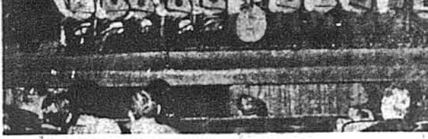
Leo Mol-Molodozhanyu Ukrainian sculptor from Canada, who designed and executed the Taras Shevchenko monuments in the US and Argentina.