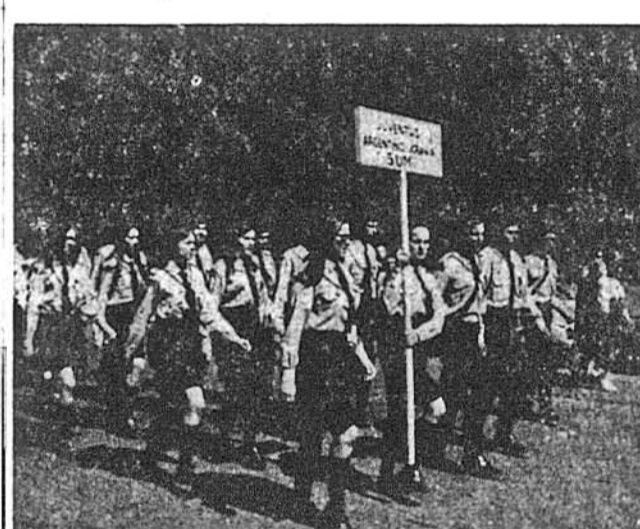
Група дівчат із Спілки Української Молоді (СУМ) в Аргентині в походи до пам'ятника Шевченкові, щоб взяти участь у величньому торжестві його відкриття.