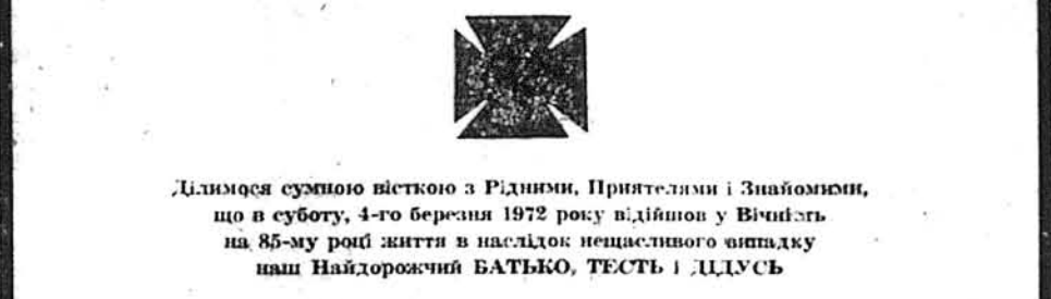
Дилимося сузною вісткою з Рідними, Приятелями і Знайомими, що в суботу, 4-го березня 1972 року відійшов у Вічність на 85-му році життя в наслідок нещасливого випадку наш Найдорожчий БАТЬКО, ТЕСТЬ і ДІДУСЬ

тийний критик Л. Новиченко обвинуватив критиків, що вони „чомусь відмовчуються“ — не бажать критикувати „суперечливі твори, що мають серйозні хиби, як скажімо, „Полтва“ і „Катасстрофа“. Виявилось, що „критики нерідко ухиляються від принципового розгляду нових творів“.