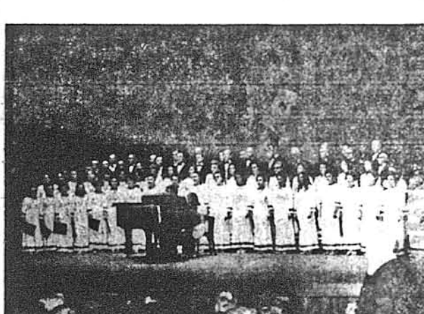
З нагоди відкриття пам'ятника Тарасові Шевченку в Буенос Айресе влаштовано „Тиждень Української Культури", що включає виставку українського народного мистецтва, фестиваль української пісні і танку, пресову конференцію і прийняття для делегації з інших країн, наукову доповідь, філіателістичну виставку, бал та ювілейний Шевченківський концерт у заповненій ещерт великій на 1,700 місць залі театру Колісео. Хори, танцюристи-балет, і солісти та бандуристи виконали програму концерту, що й видно на цих фотознімках.