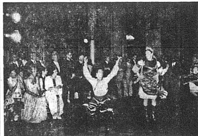
Очевидно, що під час прийняття не могло обійтись і без показу прекрасних українських народних танків. No show is complete without the colorful Ukrainian folk dancing. Above a group of Ukrainian dancers whirl to the delight of hosts and guests.