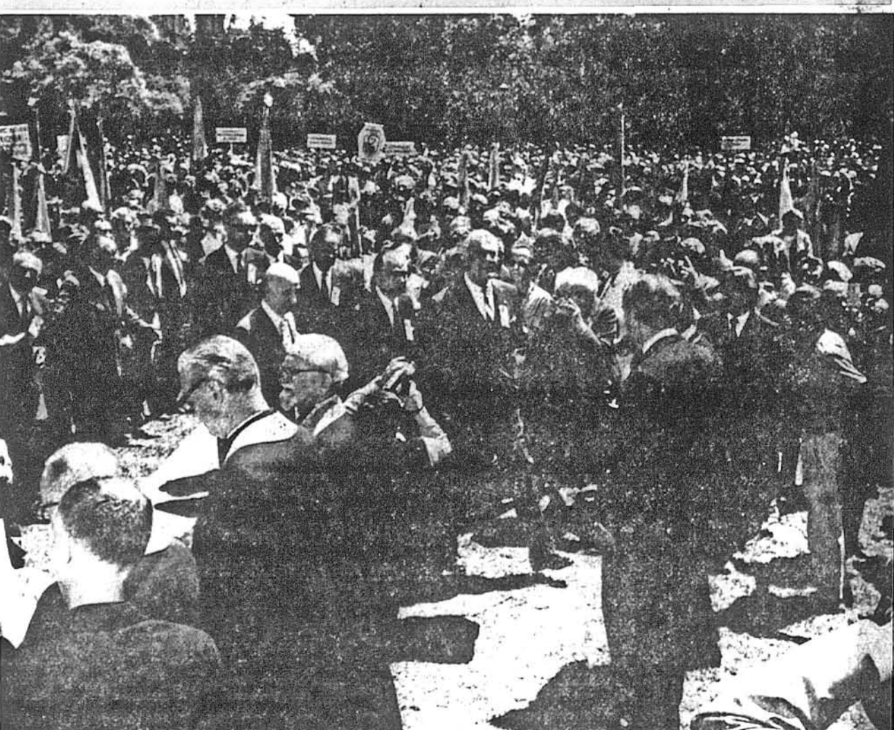
Для зібраних біля закритого пам'ятника Тарасові Шевченкові в Буенос Айресі зближається торжественна хвилинка відкриття, як до пам'ятника підходять репрезентанти двох великих північно-американських країн в Аргентині: амбасадор ЗСА Джон Дейвіс Ладж і амбасадор Канади Альфред П. Біссонет (на фото по середині), яких супроводить президент Секретаріату СКВУ Йосип Лисогір.