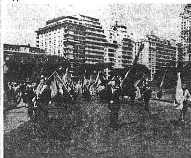
Відкриття пам'ятника Тарасові Шевченкові в Буенос Айресі попередив могутній похід вулицями аргентинської столиці, в якому взяли участь численні місцеві організації зі своїми прапорами та численні українські памомники з багатьох країн світу, зокрема з Канади і ЗСА.