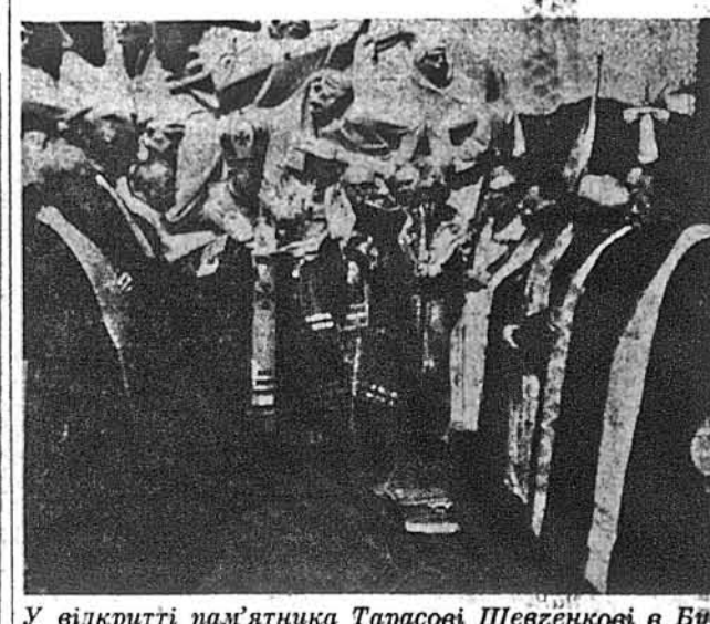
У відкритті пам'ятника Тарасові Шевченкові в Буенос Айресі взяли численну участь священники Українських Православної і Католицької Церков із своїми Владиками Митрополитом Української Автокефальної Православної Церкви Владикою Мстиславом та Єпископом цієї Церкви Владикою Іовом і український католицьким єкзархом Аргентини Владикою Андрієм Сепеляком.