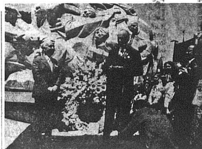
Перед відкриттям пам'ятником став годовний репрезентант країни Вашингтона в столиці Аргентини, амбасадор Джон Дейвіс Ладж, щоб виголосити своє пам'ятне слово. Амбасадор Ладж говорив іспанською мовою країни, що — як і раніше Америка — шанувала Кобзаря України поставленням йому величного пам'ятника. Біля амбасадора Ладжа стоїть репрезентант Світового Конгресу Вільних Українців, тодішній президент його Секретаріату, Йосип Лисогір.