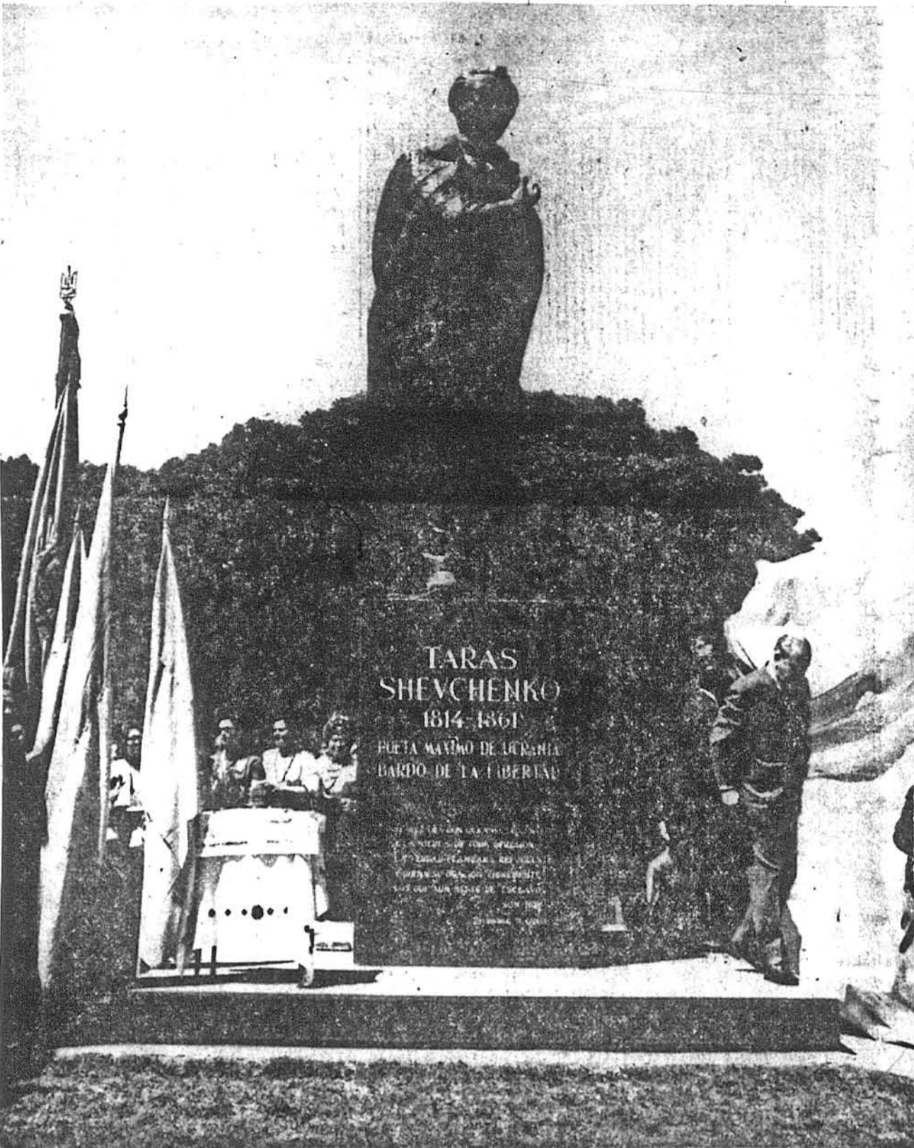
TARAS SHEVCHENKO 1814-1861 PUERTA MAYURO DE UCRAINA BARDO DE LA LIBERTAD

Неділя, 5-го грудня 1971-го року, увійде в історію, як найбільше українське національне свято в Південній Америці. Того дня, при великому здвизі народу, в цьому й численних українських паломництв з інших країн, зокрема з Канади і З'єднаних Штатів Америки, торжественно відкрито в столиці Аргентини, Буенос Айресі, величавий пам'ятник Кобзареві України, Тарасові Шевченкові. Описи цих торжеств були своєчасно подані на сторінках „Свободи” і англомовного „Українського Тижденика”. На цьому місці подаємо деякі із фотознімків, на яких утривало поодинокі фрагменти цієї історичної події.