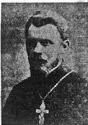
Владика Василь Величковський

Рим (Юстин). — Звільнення з совєтської тюрми і несподіваний приїзд до Риму українського католицького єпископа з України знов заактуалізували у світовій пресі важке положення Української Католицької Церкви. Знов преса заговорила про переслідування українських католиків в СРСР, про наявність там підпільної Церкви із священством й ієрархією та про розучу несправедливості, з якою совєтський режим ставиться до вірних цієї Церкви в Україні. Разом з тим піднесено справу ставлення Ватикану до цієї Церкви, яка не знаходить для себе в римських чинниках належних оборонців. Аргумент, піднесений Верховним Архієпископом Кир Іосифом Сліпим на Папському Синоді про те, що в Римі забули про цю Церкву і що її уважаться перешкодою для різних дипломатично-еккуменічних контактів Ватикану, преса знов ще виразніше підкреслила. Це раз вишліли на поверхню доволі напружені відносини між українською ієрархією і мирянами, з одного боку, та Ватиканом, з другого.