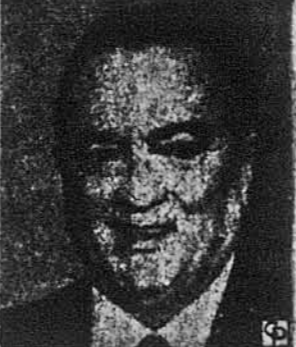
Джей Едгар Гувер

Вашингтон. — У вівторок 2 травня ц.р. помер тут у своєму мешканні на 77-ому році життя директор Федерально-го Бюро Інвестицій — Еф-Бі-Ай — протягом останніх 48 років Джей Едгар Гувер. Смерть постягла його під час сну несподівано в наслідок високого тиснення крові вночі з понеділка на вівторок після вивощеного працює дня. Офіційне повідомлення про смерть Джей Едгара Гувера проголошено у вівторок в 11-ій годині ранку. Одноголосним рішенням Конгресу постановлено, що тіло Покійного буде виставлено в Капітолію — почесно, що її досі признало тільки двадцять й одній особі, в тому числі самим президентам і колишнім президентам країни. Похорон Джей Едгара Гувера відбудеться в четвер 4 травня ц.р., прощальну промову виголосить президент Річард М. Ніксон. Похоронні обряди проведуть священники з Пресвітеріанської Церкви, до якої Покійний належав.