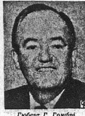
Губерт Г. Гомфрі

Індіанопіс. — Сенатор Губерт Г. Гомфрі здобув малу перемогу над губернатором Джорджом Воллесом у правиборах в штеті Індіяна у вівторок, 2-го травня. У початкових підсумках голосів сенатор Гомфрі мав 46 відсотків, у порівнянні із 42%, що їх мав губернатор Воллес та 12 відсотками голосів, що їх віддав на кандидатуру сенатора Едмунда Москі, хоча він уже відступив від активної кандидатури. Також у штеті Огайо початкові підсумки голосів давали малу перемогу сенатору Гомфрі над сильним в тому штеті кандидатом сен. Джорджа МекГоверна. Минувло вітрика відбулися правибори також в штеті Алабама, в якому виразу перевагу мав губернатор Воллес, та в Дістрікті Колумбія, в якому всі обрали делегата на Демократичну конвенцію заявився за "фаворизованим сином" Дістрікту, о. Волтером Е. Фобтросом. У кандидатурі Республіканської партії президент Ніксон в усіх тих правиборах мав тільки номі-