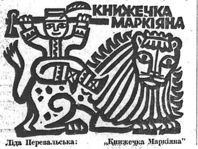
Ліда Перевальська: «Книжечка Маркіяна»

Вступна стаття і упорядкування: Микола Вірук. Мистецьке оформлення і макет: Богдан Певний. Технічний редактор: Роман Беренчич. Видання № 5. «Свобода», Р.О. Box 595, St. Louis, Mo., U.S.A. 1-4 авторів, 110 сторінок, з чого 6 кольорових. Стр.: 304. Форм.: 177 x 185 мм. 1972.