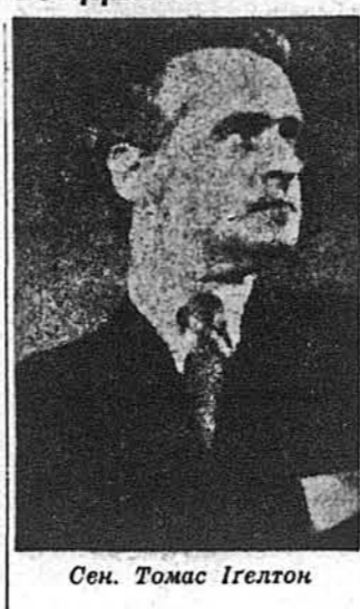
Сен. Томас Ігелтон

Вашингтон. — Сенатор Томас Ігелтон послухав побажання сенатора Джорджа МекГоверна, демократичного кандидата на президента, і зрезигнував з кандидатури на віце-президента, кажучи, що обстоюванням своєї кандидатури він не бажав би "поділити Демократичну партію". Причиною його резигнації була справа його нервової недуги, з якої він лікувався електричними шоками, в 60-тих роках, а виявлення ним же самим цієї його минулої недуги стало предметом завзятих дебат серед самих демократів, причому голося були поділені. Сенатор МекГоверн, який початково "тисяча - відсотково" даліше обстоював кандидатуру Ігелтона, не зважаючи на виявлену ним минулу недугу, опісля змінив свою думку, побоюючись, що кандидатура Ігелтона могла б стати головним аргументом у виборчій кампанії, замість внутрішніх і зовнішніх політичних справ. Сенатор Ігелтон погодився зрезигнувати з кандидатури на віце-президента під час спільної конференції у Вашингтоні в поведінок, 31-го липня. Опісля Ігелтон і МекГоверн виступили на пресовій конференції, повідомляючи про їх рішення. МекГоверн також заповів, що він говоритиме про цю справу до народу під час його телевізійного виступу у віторок, 1-го серпня, ввечерю. Під час пресової конференції сенатор МекГоверн заявив, що не теперішній стан