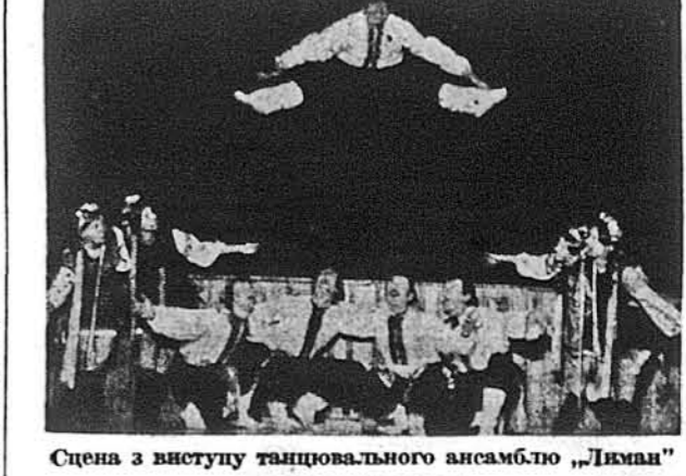
Сцена з виступу танцювального ансамблю "Лиман"