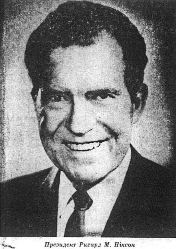
Президент Річард М. Ніксон

Маямі Біч, Флоридя. — Як можна було очікувати, Республіканська Конвенція у віторок 22-го серпня найменувала Річарда Мілгавза Ніксона своїм кандидатом на перевибір на президента 37-тих Стейтів Америки на чергову чотирирічну каденцію. 1,347 голосів віддано за номінацію президента Р. Ніксона і тільки один голос делегата з Нью Мексіко віддано на "інших", себто на конгресмена Пола Н. Мек-Клоскі з Каліфорнії, щоб в той спосіб задовольнити вимогу виборчого закону.