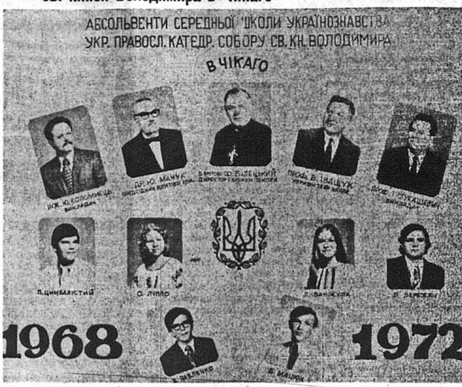
АБСОЛВЕНТИ СЕРЕДНЬОЇ ШКОЛИ УКРАЇНОЗНАВСТВА УКР. ПРАВОСЛ. КАТЕДР. СОБОРУ СВ. КН. ВОЛОДИМИРА В ЧИКАГО