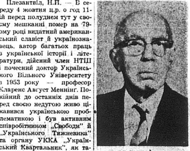
сл. п. професор Кларенс Август Меннінг

Плезантвіл, Н. Й. — В середу 4 жовтня ц. р. о год. 11-ій перед полуднем тут у своєму мешканні помер на 79-ому році видатний американський славіст й українознавець, автор багатьох праць з української історії і літератури, дійсний член НТШ і почесний доктор Українського Вільного Університету з 1953 року — професор Кларенс Август Меннінг. Покійний до останніх днів перед своєю недугою живо цікавився українською проблематикою і був активним співробітником „Свободи“ й „Українського Тижневика“ та органу УККА „Український Квартальник“, як також автором статей у багатьох збірниках і виданнях. Разом із сл. п. д-ром Л. Мишугою був ініціатором й активним співучасником видання й редагування Англо-мовної Енциклопедії Українознавства.