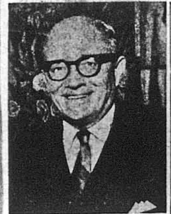
Проф. д-р Лев Добрянський — Президент УККА