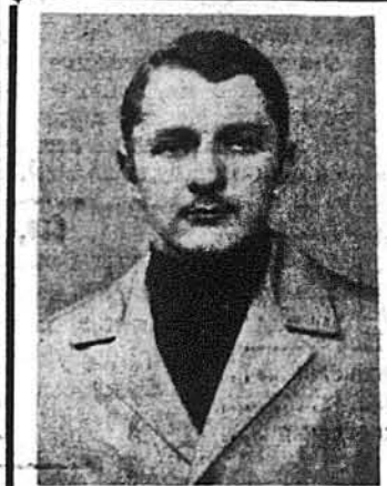
У глибокому смутку і жалю повітрямсьо Рідних, Приятелів і Знайомих, що дня 8-го жовтня 1972 р. о годині 12-їй дня відправлення в Церкві св. Духа при N. 5-й вул. в Брукліні, Н. П.

У ВАШИНГТОНІ, Д. К., ЗАКІНЧИВСЯ страйк учителів, який тривав два тижні. Тепер 141 000 дітей-школярів Дистрикту Колумбії повернулися до своїх шкіл, де вони й учителі муситимуть добре попрацювати, щоб наддогнати втрачений час.