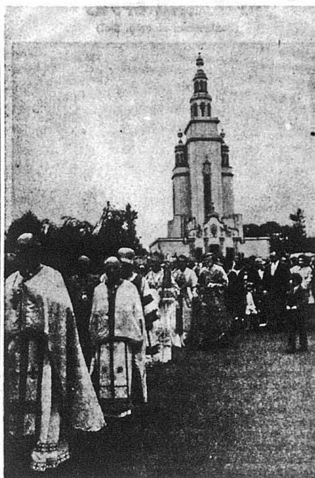
Владика і священники в поході з Церкви - Пам'ятника на новонабуту поспієсть.

(Світлий П. П. Старостяк, 1881 Лінген Ст., Ріджвуд, Н. Й. 11227).