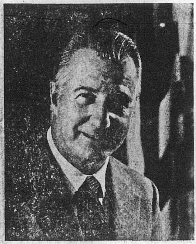
ВИЦЕ-ПРЕЗИДЕНТ СПІРО ЕГННО