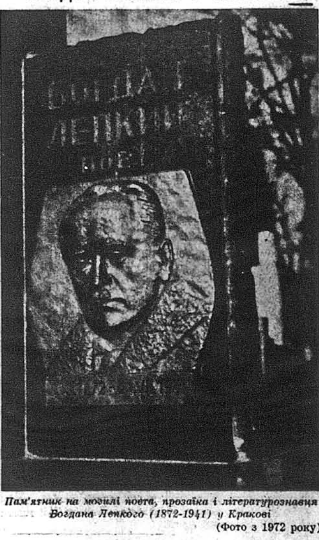
Пам'ятник на могилі поета, прозаїка і літературознавця Богдана Лепкого (1872-1941) у Кракові (Фото з 1972 року)