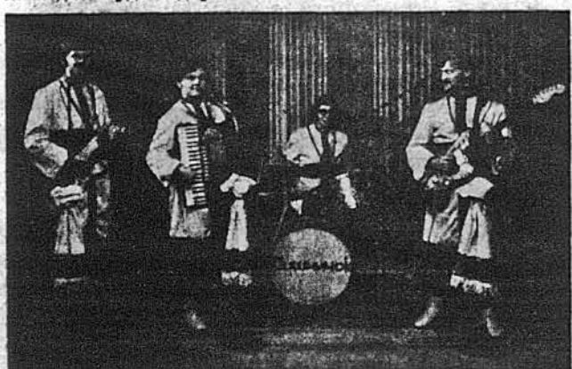
Оркестра „Рушничок“ з Монреалю

ПРЕДСТАВНИКИ АМЕРИКАНСЬКОЇ НАФТОВОЇ ІНДУСТРІЇ перестерігають, що існує можливість, що цілі зими буде брак оливи для ogrівання будинків. Нафтова індустрія закликає федеральний уряд, щоб він збільшив імпорту нафти та виробив план постачання нафти до всіх частин Америки.