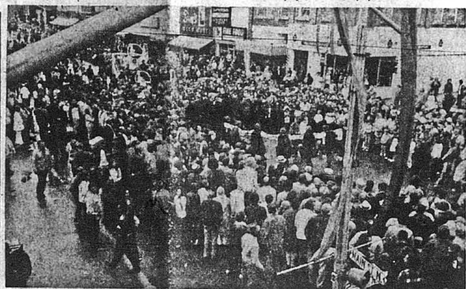
Одна із багатьох сцен парадного походу замаялими канадськими і українськими вулицями Давфину під час Крайового Українського Національного Фестивалю Канади.

Давфін, Манітоба. — Цьогорічний Український Національний Фестиваль Канади за час своєї восьмичаті історії належить до найуспішніших, як щодо кількості учасників, так і щодо рівня окремих мистецько-культурних точок. За даними організаторів Фестивалю, близько 40,000 осіб з майже усіх провінцій Канади, з ЗСА, Європи і навіть Австралії та Нової Зеландії відвідали фестивальні імпрези в дні 2-5 серпня. Покази українського хорового, музичного та хореографічного мистецтва стягли тисячі глядачів українців і не-українців. Не меншою популярністю відзначилися виставки зразків українського народного мистецтва та предметів щоденного вжитку піонерської доби. Про вже визнане і закріплене значення того роду фестивалю засвідчує в а лі привітальні листи і телеграми від федерального та провінційних урядів, починаючи від привітального листа прем'єр-міністра П'єра Трюдо, який підкреслює важливість фестивалю, як прекрасної нагоди для канадських українців об'єднатися у спільний культурний традиції, яку всі разом плекують. Ваша традиція своїми блискучими нитками вплелася у багату тканину канадського суспільства. Життєвість українських нападів як одиниць допомагає стримувати ці традиції життя і динамічними. Цьогорічний фестиваль вітала також вперше королева Єлизавета II, яка якраз тоді перебувала в Оттаві з офіційними відвідинами. Фестивальні імпрези почалися вже 2 серпня, але