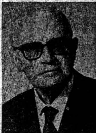
Проф. д-р Вол. Кубійович